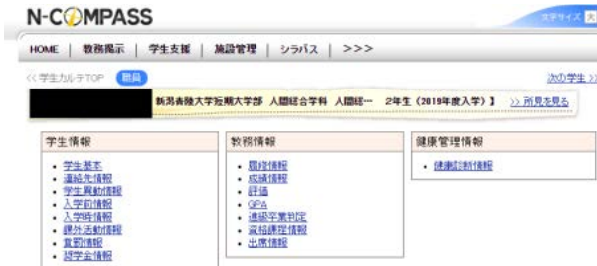
図 II-B-1-① N-COMPASS 学生カルテ

教員はもちろん各学生のアドバイザー教員も状況把握ができるようになっている。特に、N-COMPASS・学生支援「学生カルテ」には、以下に示した学生情報、教務情報、健康管理情報が入力され、アドバイザー教員は、担当学生の学習成果の状況に応じて適宜指導を行っている。