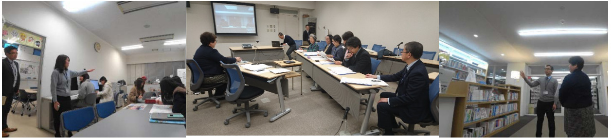
第3回相互交流連絡会(於：TV会議 平成29(2017)年12月18日)