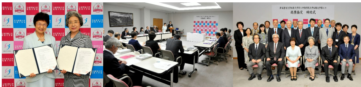
連携協定式(於：中部学院大学関キャンパス 平成 28 (2016) 年 9 月 20 日)