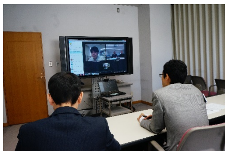
コンピューター・ネットワークに関する意見交換会(於：TV会議 平成28(2016)年11月1日)