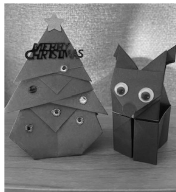
* 作品例 *